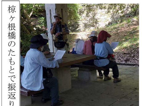
椋ヶ根橋のたもとで振返り