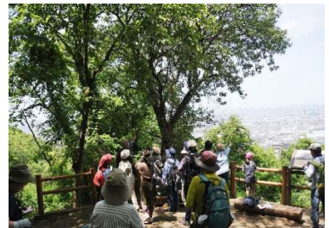
中展望 大阪城が見えるかな